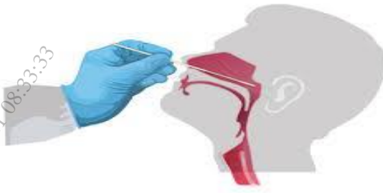
Hình 1: Lấy mẫu ngoáy dịch ty hầu